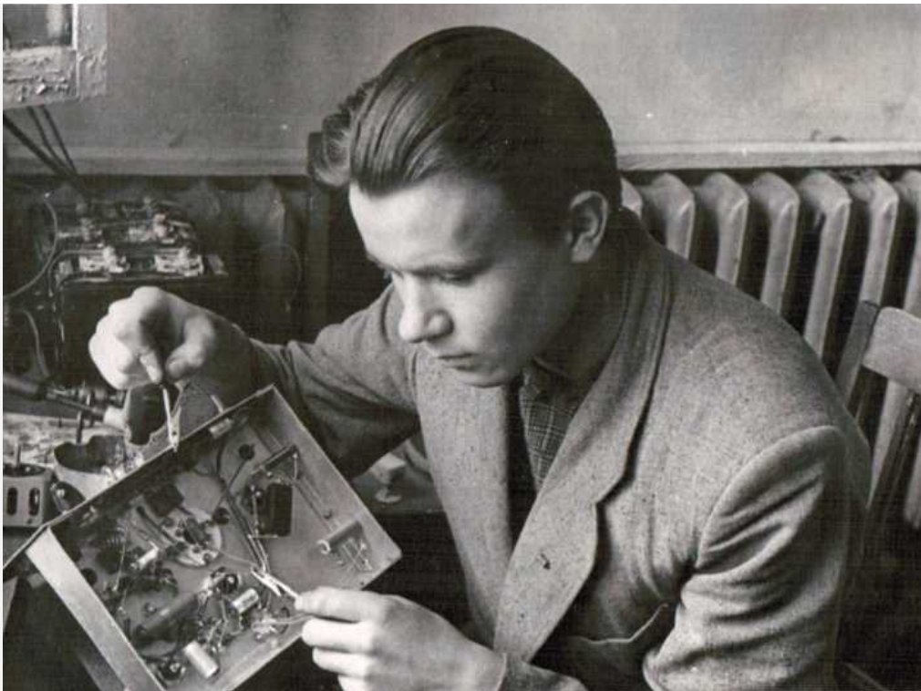
Проверка передатчика школьной радиостанции UA3KPZ (1960 год)

На крыше дома стояла самодельная вертикальная антенна на диапазон 28 мегагерц. На самом верху была укреплена неоновая лампочка и она загоралась при включении радиостанции на передачу. До сих пор проходя рядом с этим домом вспоминаю далёкие шестидесятые годы, когда я впервые перешагнул порог этого гостеприимного дома.