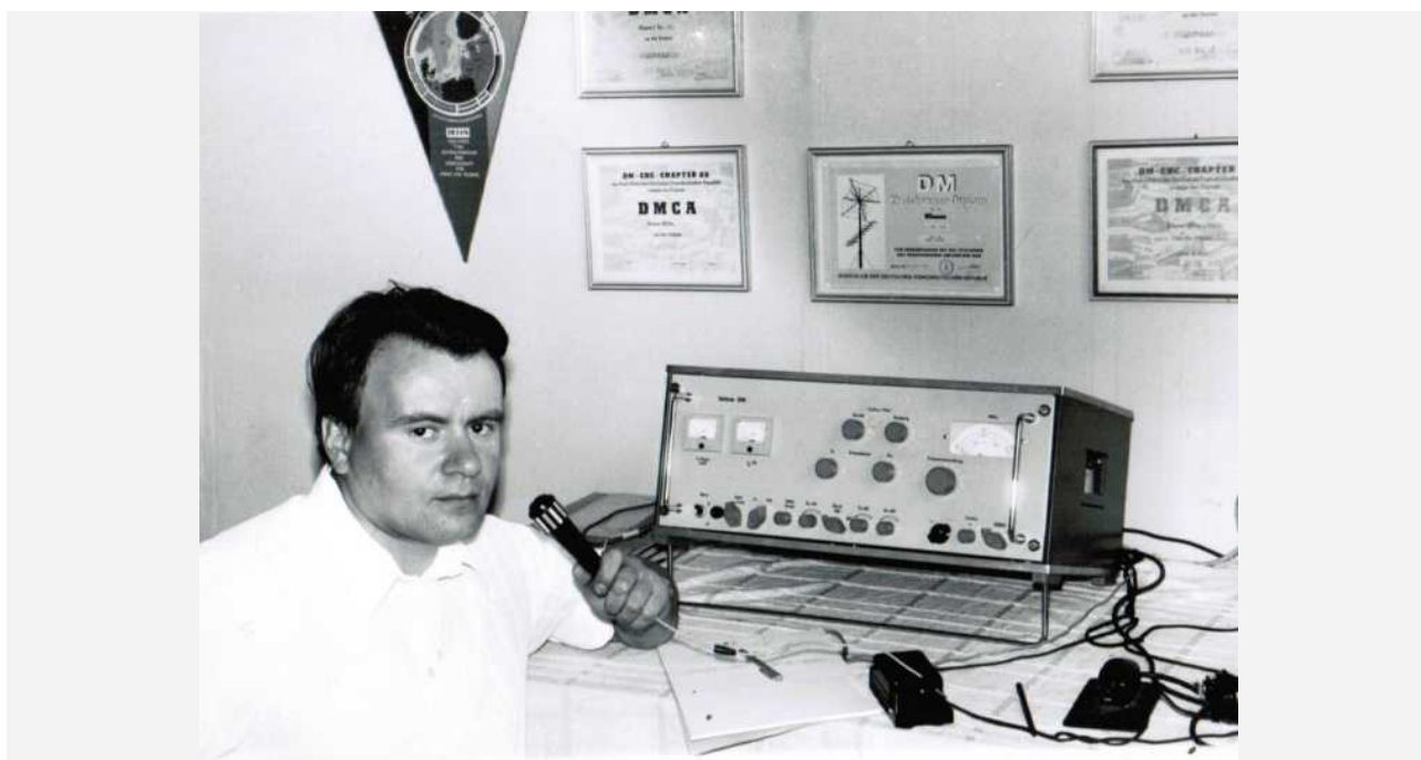
На коллективной радиостанции города Нейрупин (ГДР) у трансивера «Телтов 215»)