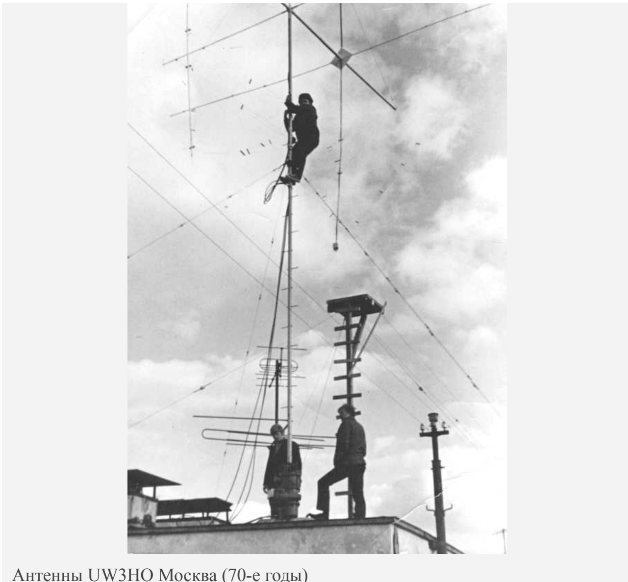
Антенны UW3НО Москва (70-е годы)