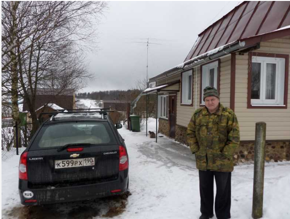
Встреча гостей в Старой Хотче (2015)