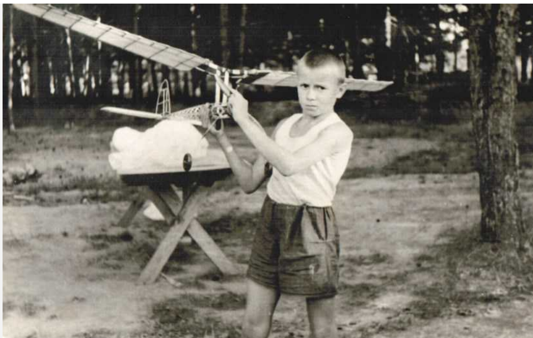
Мечта о небе (50-е годы)