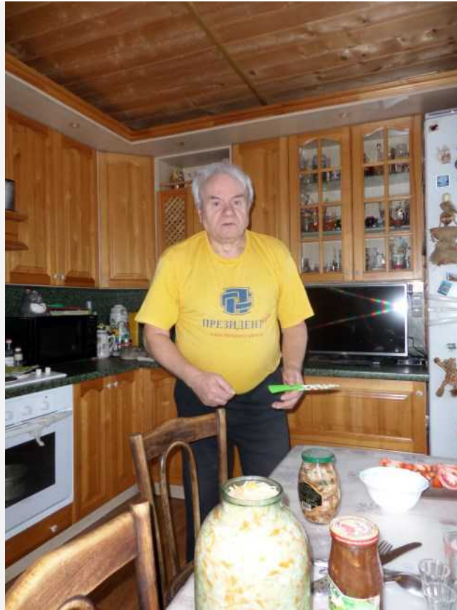
Ждём гостей. Старая Хотча (2015)

пожелания тебе на долгие годы мой друг и наставник. Успехов и здоровья.